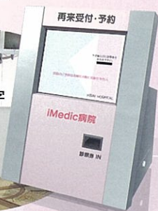
自動再来・予約受付機