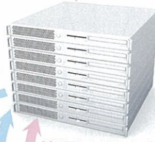
管理用 Web サーバ